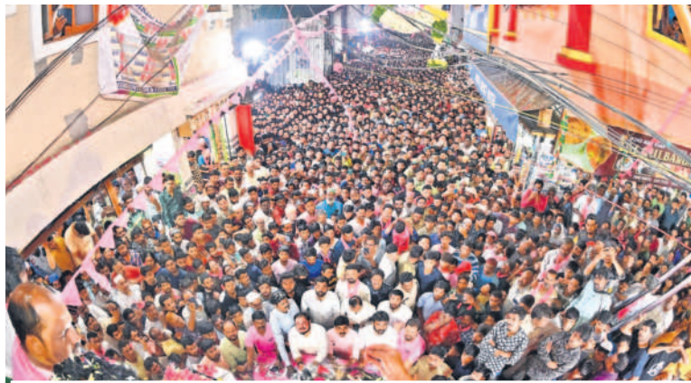
జననంద్రమైన ముషీరాబాద్ రోడ్ షో