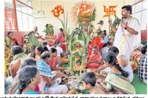
చేగుంట మహంకాళి ఆలయంలో సామూహిక సత్యనారాయణ వ్రతాలు ఆచరిస్తున్న భక్తులు