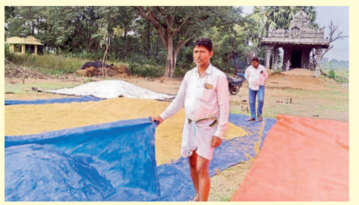
దేశాల సంపాదనకే ధరలే రద్దు

రేగండ్ : కాంగ్రెస్ లో దేశాలు ఉన్నాయి సంపాదించుకోవడానికే ధరలే రద్దు చేస్తామంటున్నారు తప్ప వారి మేలు కోసం కాదు. అలాంటి రాక్షస కాంగ్రెస్ పాలన మాకు వద్దే వద్దు. ఎప్పుడు రైతు మేలు కోరి ప్రభుత్వం రావాలి. రైతు మేలు కోరి ప్రభుత్వం అంటే అది కేసీఆర్ సారే మాత్రమే. ఏండ్ల తరబడి పట్టాల కోసం కార్యాలయాల చుట్టు చెప్పాలిగోలా తిరిగినా ఎవరూ పట్టించుకోలేదు. దీంతో మా భూమి జాగ్రత్త రక్షణ లేకుండా పోయింది. పాపం కేసీఆర్ సారే దయవల్ల మా భూములకు రక్షణ రావడంతో బ్యాంకోళ్ల మా ఇండ్ల వద్దనే వచ్చి లోన్ను ఇస్తున్నారు. మేము ఎక్కడున్నా రైతులంధు పునరు మంచిగ పడుతున్నాయి. మాకు ఇలాంటి పాలనలే కావాలి అందుకు మేముకా కలిసి పనిచేస్తాం. కేసీఆర్ సారినే మళ్లా గెలిపించుకుంటాం.