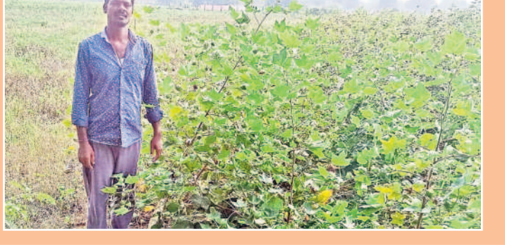
కాంగ్రెస్ ను ఈ ఎన్నికల్లో బొందపట్టాలి