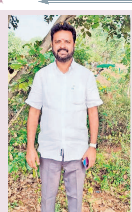
భూముల విలువ పడిపోతుంది..

సాగు తగ్గితే ఆహార భద్రతకు ముప్పు ఏర్పడుతుందంటున్నారు. గ్రామాల్లో 70శాతం వ్యవసాయం మీద ఆధార పక్ష కుటుంబాలవారు ఆదాయం కోల్పోతారని, గ్రామీణ ఆర్థిక వ్యవస్థ దెబ్బతింటుందని చెబుతున్నారు. మూడు గంటల కరెంట్ వల్ల సాగుకు నీరు సరిపోతే ఈ రకంగా మానసా సాగు వ్యవస్థం మీద దెబ్బపడుతుందని స్పష్టం చేస్తున్నారు. ధరలు మళ్లీ సాతరణలు వస్తాయని అంటున్నారు. తెలంగాణలో చిన్న కమిటీలున్న కుటుంబాలవారు అనేక మంది దూరంగా ఎక్కడో ఉద్యోగాలు చేసుకుంటూ గ్రామాల్లోని తమ భూములను కౌలుకిచ్చి వ్యవసాయం చేయిస్తున్నారు. అంతే తప్ప కౌలుకు ఇచ్చే రైతులంతా వందల ఎకరాలన్న వారే కాదని, చిన్న, మధ్య తరగతి ఉద్యోగులను ఈ సమస్యలన్నీ చుట్టుముడితే బిరుద్యోగులకు ఎంతో కొంత ఆసనా అయ్యే ఈ అదనపు ఆదాయం కూడా కోల్పోతారని అభిప్రాయపడుతున్నారు. గ్రామాల్లో వ్యవసాయం పనులు లేకపోతే మళ్లీ వలసలు మొదలుపెట్టాయని,