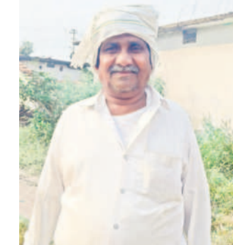
అప్పుడు కోతలు తప్పకరెంటు యాడిది..

కాంగ్రెస్ పార్టీ పాలించినప్పుడు కరెంటు కోతలు తప్పా మూడు కరెంట్ వచ్చింది లేదు. అరు గంటల కరెంటుని మూడు గంటలు కూడా ఇవ్వలేదు. నడిరాత్రి కరెంట్ అత్రె అప్పుడు మన్నుట్ల రైట్లు పట్టుకొని పొలాలకాడికి ఉరికిపోతే.. కరెంటు సరిగా రాక చేతికచ్చిన పంటలు ఎండిపోయిన రోజులు ఇప్పటికీ గుర్తున్నాయి. కానీ సీఎం కేసీఆర్ అచ్చినంత 24గంటల కరెంట్ తో మా బాధలు తీరాయి. అందుకే మేము కేసీఆర్ తోనే ఉంటాం.