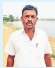
- జంగయ్యగౌడ్, మల్లపల్లి, కడ్రాల్

ఎప్పుసానికి తెలంగాణ సర్కార్ అందిస్తున్న కరెంటుతో రైతులు బాగుపడుతుండ్రు. లోవోల్టేజీ సమస్యలు, మోటర్లు కాలిపోవుడు ఇప్పుడు లేవు. ఇది వరకు కరెంటు కోసం పడ్డ బాధలు గుర్తొస్తే దుఃఖం వస్తుంది. పాలాలకు నీళ్లు పెట్టేందుకు అర్ధరాత్రి పోయేది. పాములు, తేళ్లు కరుస్తాయని భయంభయంగా ఉండేది. సీఎం కేసీఆర్ సార్ పుప్పలంగా అందిస్తున్న 24 గంటల కరెంటుతో రైతులు సంతోషంగా ఉండ్రు. రైతు మంచి గుంటే కాంగ్రెస్ కుండ్లు ముండుతున్నాయి. రైతులను కడుపులో పెట్టి చూసుకుంటున్న సీఎం కేసీఆర్ సార్ నీ తిరిగి గెలిపిస్తాం.