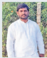
- చందు, ఊరెళ్ల, చేవెళ్ల

కాంగ్రెస్ వ్యవసాయానికి 3 గంటల కరెంటు ఇస్తామనడం అంటే మళ్ళీ పాతరోజులు వచ్చినట్లే. గతంలో కాంగ్రెస్ హయాంలో కరెంటు కోతలతో ఇబ్బందులు పడ్డాయి. పంటలు ఎండిపోయి చేసిన ఆప్పులు తీర్చలేక ఆత్మహత్యలు చేసుకోవడంతో కుటుంబాలు రోడ్డున పడ్డాయి. తెలంగాణ ప్రభుత్వం అధికారంలోకి వచ్చిన తర్వాత 24 గంటల కరెంటు ఇవ్వడంతో పంటలు పండించుకుని సంతోషంగా జీవిస్తున్నారు. 10 హెచ్పీ మోటర్లతో ఏ రైతు కూడా ఎప్పుడూ ఎదురుగా ఉన్నాడు. కాంగ్రెస్ వస్తే మూడు గంటల కరెంటు ఇస్తామంటున్నారు. వారికి ప్రజలే బుద్ధి చెబుతారు.