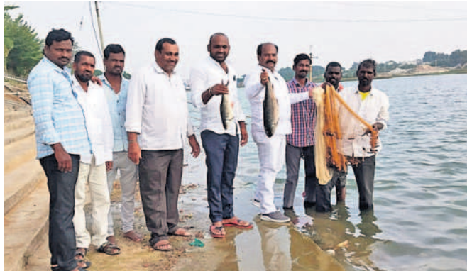
పాండవుల చెరువులో చేపలు పట్టి బీఆర్ఎస్ కు మద్దతు తెలుపుతున్న ముదిరాజ్లు