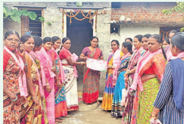
వర్గల్: మజిలీపల్లిలో ప్రచారం నిర్వహిస్తున్న మహిళలు