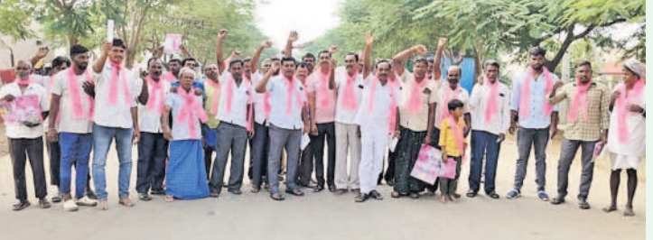
మర్నాళ్: నర్సన్న పేటలో ప్రచారం చేస్తున్న బీఆర్ఎస్ నాయకులు

ఇంటింటికీ వెళ్లకారు గుర్తుకు ఓటు వేయాలని అభ్యర్థిస్తున్న బీఆర్ఎస్ నాయకులు