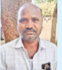
- అంజరెడ్డి, చంద్రయానపల్లి, మోమినీపేట

భూములు భద్రంగా ఉండాలంటే ధరణి పోర్టల్ తప్పనిసరిగా ఉండాలి. భూముల రిజిస్ట్రేషన్ కోసం కేసీఆర్ సర్కారు తెచ్చిన ధరణి పోర్టల్ బాగుంది. దీనిని తీసేస్తే రైతులకు మళ్లీ కష్టాలే. కౌలు చట్టం, రెవెన్యూ రికార్డుల్లో పాతకాలం నాటి పద్ధతులను అమలు చేస్తామని కాంగ్రెస్ నాయకులు చెబుతున్నారు. దీనిద్వారా మళ్లీ పట్టణం పెత్తనం వస్తుంది. ధరణి ద్వారా రైతుల భూములకు రక్షణ ఉండడంతో పాటు త్వరగా రిజిస్ట్రేషన్లు జరుగుతున్నాయి. ధరణి తీసేస్తే దళారీల హవా పెరుగుతుంది. రైతులు నష్టపోవాల్సిన దుస్థితి ఏర్పడుతుంది.