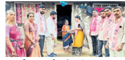
కాశీబుగ్గ: కొత్తపేటలో ఇంటింటా ప్రచారం