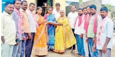
వర్తన్ పేటలో సోషల్ మీడియా ప్రతినిధుల ప్రచారం