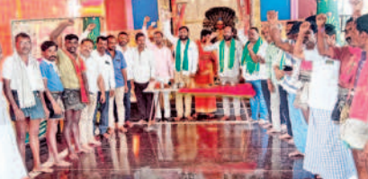
హాసన్పల్లి: రేణుక ఎల్లమ్మ ఆలయంలో మద్దతు