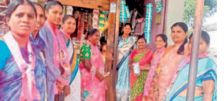
పర్యతగిరి: అన్నారంలో అరూరి గెలుపు కోరుతూ..