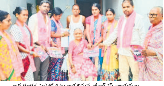
ఆత్మకూరు(ఎం)లో ఓటు అభ్యర్థిస్తున్న బీఆర్ఎస్ నాయకులు