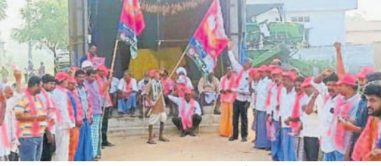
ఆత్మకూరు(ఎం) : తిమ్మాపురంలో ప్రచారం చేస్తున్న బీఆర్ఎస్ శ్రేణులు