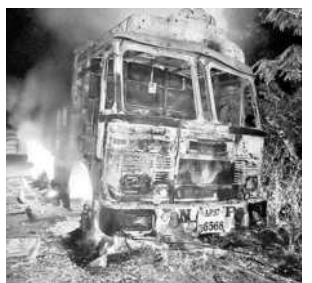
ఘటనా స్థలంలో దగ్ధమైన లారీ

చర్ల, నవంబర్ 28: ధాన్యం లోడుతో వస్తున్న ఓ లారీని మావోయిస్టులు దహనం చేసిన ఘటన మంగళవారం రాత్రి చోటుచేసుకున్నది. తెలిసిన వివరాల ప్రకారం.. రాష్ట్ర సరిహద్దు ప్రాంతమైన పూసు