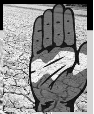
చేసే పరిస్థితి ఉండదు. పాత పద్ధతిలో సాసైటీల ద్వారా ఎరువులు ఇవ్వడం వల్ల పెద్ద రైతులకు మాత్రమే ఎరువులు లభించే పరిస్థితి ఉంటుంది. దీంతో చిన్న రైతులు వ్యవసాయానికి దూరమయ్యే ప్రమాదం ఉంది. చిన్న కమతాలలో వ్యవసాయం చేయలేక మళ్ళీ కూలీలుగా మారి పరిస్థితి ఉండబోతుంది. ధరణిని తీసివేస్తే కాలు రైతులకు రైతుబంధు ఇచ్చే ప్రతిపాదనను కాంగ్రెస్ తీసుకొస్తామంటున్న తరుణంలో రైతులు పొలాలను కొలుకు ఇచ్చే పరిస్థితి ఉండదు. దీంతో సక్కబడ్డ సాగు భూములన్నీ మళ్ళీ బీళ్లుగా మారబోతాయని రైతులు చర్చించుకుంటున్నారు. కాంగ్రెస్ పార్టీ నాయకుల మాటల పట్ల ఉమ్మడి జిల్లావ్యాప్తంగా రైతులు, రైతు కూలీలు, చిరు వ్యాపారులు, గృహిణులు మండిపడుతున్నారు. ఒకవైపు ధరణి తీసివేయడంతోపాటు మరోవైపు మూడు గంటల కరెంటుపై పదే పదే మాట్లాడుతుండడంతో ఆ పార్టీ నాయకులకు ఎన్నికల్లో తగిన రీతిలో సమాధానం చెబుతామని పేర్కొంటున్నారు.