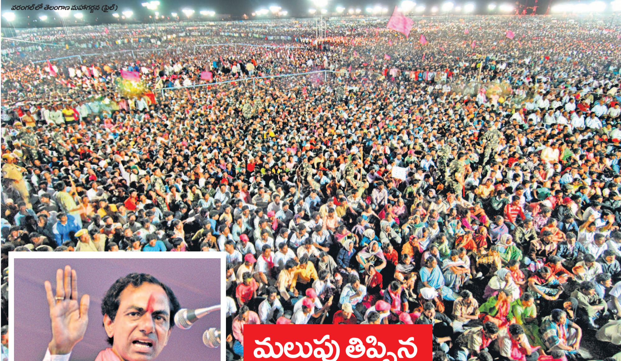
వరంగల్ లో తెలంగాణ మహాగర్జన (ఫైల్)