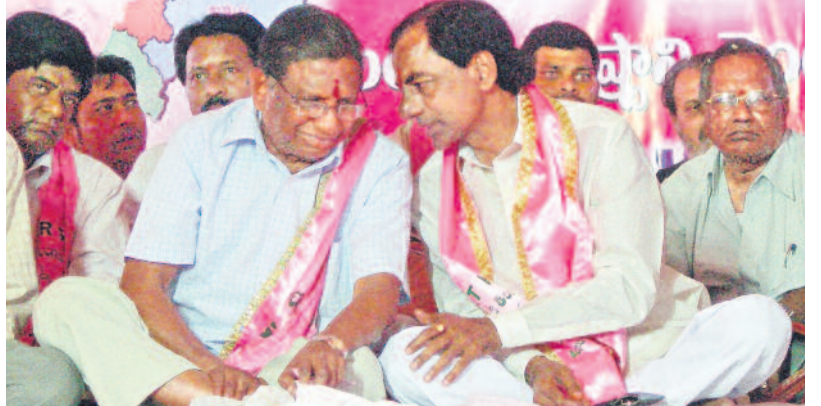
ప్రాధాన్యత జయశంకర్ తో కేసీఆర్ (ఫైల్)

తెలంగాణ రాష్ట్ర సాధనే ధ్యేయంగా కేసీఆర్ బయలుదేరినప్పటి నుంచి పుష్కరకాలం ఉద్యమానికి అటు ఆచార్య కౌతూహల జయశంకర్ సారీ ఇటు ఉద్యమనేత కేసీఆర్ రెండు కాళ్లలా కలియదీచిారు. జయశంకర్ సారీ పది మంది గుమిగూడినప్పుడు ఏ ఆర్టికల్ తెలంగాణ వాదాన్ని వినిపించారో.. 25 లక్షల మందితో 2010, డిసెంబర్ 16వ తేదీన వరంగల్ లో బీఆర్ఎస్ పార్టీ నిర్వహించిన తెలంగాణ మహాగర్జనలోనూ అంతే ఆర్టికల్ అభివ్యరించారు. తెలంగాణ సిద్ధాంతకర్తగా స్థిరపడిన జయశంకర్ సారీ జూన్ 21, 2011లో మరణించారు. తెలంగాణ ఒక్కసారిగా తల్లిదండ్రులు, రాష్ట్ర సాధన ఉద్యమంలో తన వేలుపట్టి నడిపించిన జయశంకర్ సారీ మరణం తనను తీవ్ర ద్విగ్ధునిగా గురిచేసిందని వెక్కిరిస్తూ ఏడ్చారు. ఆయన మరణం తెలంగాణకు తీరని లోటు. జయశంకర్ అంతిమసంస్కార యాత్ర తెలంగాణ లాంగ్ మార్చ్ తలపించింది.