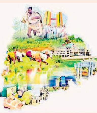
ఒక లక్ష్యం ఒక అణిండా ఒక నినాదం ఒక సంకల్పం ఒక శపథం ఒక అద్భుత ఘట్టం అదే 'ఒక తెలంగాణ'

పాలనను ములుపు తిప్పింది సభలే.. ఉద్యమ పార్టీగా ప్రజల్లో చైతన్యాన్ని రగిలించిన బీఆర్ఎస్ రాష్ట్ర సాధన అనంతరం ఉద్యమ న్యూర్నితో ముందుకు సాగుతున్నదని ఈ తొమ్మిది నెలల కాలంలో సీఎం కేసీఆర్ అనేక సభల ద్వారా నిరూపించారు. నాడు ఉద్యమంలో ముందుడి ప్రజలను నడిపించినట్లుగానే.. నేడు అభివృద్ధి, సంక్షేమం దిశగా ప్రజలను నడిపిస్తున్నాడు. పార్టీకి కట్టమైనా, సుఖమైనా.. జయమైనా, అవజయమైనా అన్నీ ప్రజలేనని మొదటి నుంచీ కేసీఆర్ అంటుంటారని ఆయనను దగ్గరి నుంచి చూసిన వాళ్లు చెబుతుంటారు. ఆయన ఆలోచనలు, ఆశయాలు సభల ద్వారా ప్రజలకు తెలియ మమేకం చేస్తున్నారు. 2017 ఏప్రిల్ 27న వరంగల్లో నిర్వహించిన పార్టీ 16వ వార్షికోత్సవ సభలో కేసీఆర్ నేతృత్వంలో సభలో ప్రజలను నడిపిన స్వల్ప కాలంలో సీఎం కేసీఆర్ అనేక సభల ద్వారా తెలంగాణ అభివృద్ధిని ప్రజల ముందుంచారు. తన అభిప్రాయాలను ప్రజలతో పంచుకుంటూ వారి ఆశీస్సులతో నేటికీ అజేయంగా ముందుకు సాగుతున్నారు.