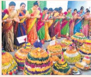
పెద్దాయనోచ్చినంతనే.. అటు పాటు అందలమెక్కినయం బొట్టు, బోనం బంగారమంది.. బతుకమ్మకు ప్రసవమే పట్టు వట్టింది.. మన యానకు సినిమా హాసంతెంది తెలుగు బతుకు చిత్రమే వెలుగుతుంది. -సురేందర్ బండారు