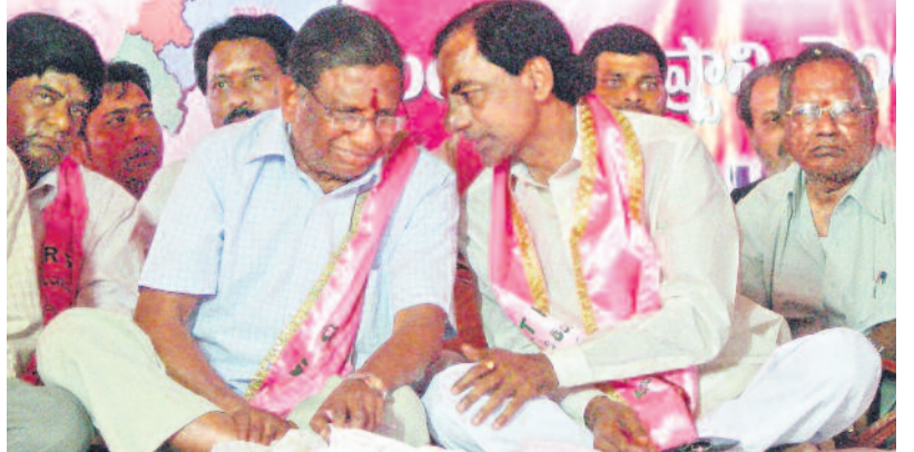
ప్రాధాన్యత జయశంకర్తో కేసీఆర్ (ఫైల్) హనుమంతం ఏకలిలా పార్కు నుంచి పద్మావతి గట్టు దగ్గరికి జయశంకర్ సార్ అంతిమయాత్రను ఆనాడే కేసీఆర్ నడిపించారు. జయశంకర్ ఆతిథ్యం కలిగి ఉన్నారు.

తెలంగాణ రాష్ట్ర సాధనే ధ్యేయంగా కేసీఆర్ బయలుదేరినప్పటి నుంచి పుష్కరకాలం ఉద్యమానికి అటు ఆచార్య కౌతూహల జయశంకర్ సార్ ఇటు ఉద్యమనేత కేసీఆర్ రెండు కాళ్ళలా కలియలిగారు. జయశంకర్ సార్ పది మంది గుమిగూడినప్పుడు ఏ అర్థితో తెలంగాణ వాదనను వినిపించారో.. 25 లక్షల మందితో 2010, డిసెంబర్ 18వ తేదీన వరంగల్లో బీఆర్ఎస్ పార్టీ నిర్వహించిన తెలంగాణ మహాగర్జనలోనూ అంతే ఆర్జీని ఆపివేయలేదు. తెలంగాణ సిద్ధాంతకర్తగా స్థిరపడిన జయశంకర్ సార్ జూన్ 21, 2011లో మరణించారు. తెలంగాణ ఒక్కసారిగా తల్లడిల్లింది. రాష్ట్ర సాధన ఉద్యమంలో తన వేలుపట్టి నడిపించిన జయ శంకర్ సార్ మరణం తనను తీవ్ర దిగ్భ్రాంతికి గురిచేసింది. వెళ్లివెళ్లి వచ్చారు. ఆయన మరణం తెలంగాణకు తీరని లోటు. జయశంకర్ అంతిమసంస్కార యాత్ర తెలంగాణ లాంగ్ మార్చ్ తలపించింది.