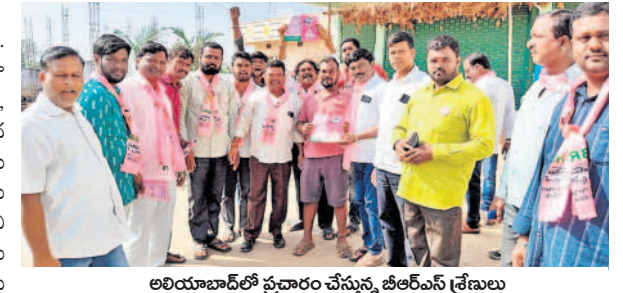
అలియాబాద్ లో ప్రచారం చేస్తున్న బీఆర్ఎస్ శ్రేణులు