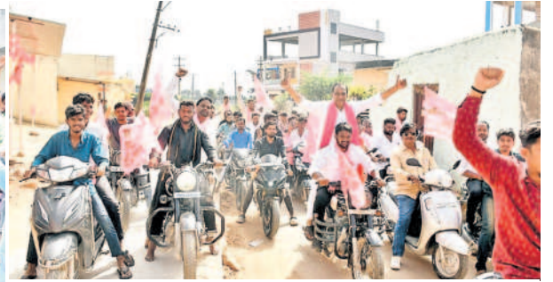
చౌదరిగూడలో జరిగిన బైక్ ర్యాలీలో పాల్గొని ఓటర్లకు విజయ సూచికను చూపిస్తున్న మంత్రి మల్లారెడ్డి