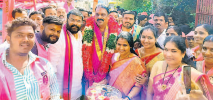
పద్మశాలిపురంలో నిర్వహించిన పాదయాత్రలో ఎమ్మెల్యే ప్రకాష్ గౌడ్ కు స్వాగతం పలికి సన్మానిస్తున్న నాయకులు

మైలారదేపల్లి, నవంబర్ 28: తెలంగాణకు కావాల్సింది బలమైన నాయకత్వం అని, స్థిరమైన ప్రభుత్వం అని అది ఒక్క కేసీఆర్ తోనే సాధ్యమని రాజేంద్రనగర్ నియోజకవర్గం ఎమ్మెల్యే, బీఆర్ఎస్ అభ్యర్థి టి.ప్రకాష్ గౌడ్ అన్నారు. ఎన్నికల ప్రచారంలో చివరి రోజైన మంగళవారం మైలారదేపల్లి డివిజన్ పరిధిలో భారీ ర్యాలీలు, పాదయాత్రలు, రోడ్ షోలు, సమావేశాలను నిర్వహించారు. ఉదయం 7 గంటలకు ప్రారంభమైన ఈ కార్యక్రమాలు నిర్విరామంగా నాయంత్రం 5 గంటల వరకు కొనసాగాయి. రాజేంద్రనగర్ నియోజకవర్గం ఎమ్మెల్యే టి.ప్రకాష్ గౌడ్ ఉత్సాహంగా నాయకులు, కార్యకర్తలతో కలిసి ర్యాలీలు, పాదయాత్రల్లో పాల్గొన్నారు. దీంతో నాయకుల్లో మరింత జోష్ నిండింది. మహిళలు పెద్ద ఎత్తున హాజరై ఎమ్మెల్యే టి.ప్రకాష్ గౌడ్ బొట్టుపెట్టి హారతులు పట్టారు. అడుగుడుగునా నీరాజనం పలుకుతూ బీఆర్ఎస్ ర్యాలీకి బ్రహ్మారథం పలికారు. ఈ సందర్భంగా