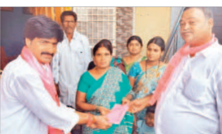
అలంపూర్ చౌరస్తాలో ప్రచారంలో పాల్గొన్న విజయం