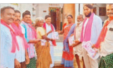
అయిజ : సంకాపురంలో పాల్గొన్న బీఆర్ఎస్ శ్రేణులు