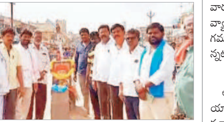
పూలే చిత్రపటం వద్ద నివాళులర్పిస్తున్న ప్రజా సంఘాల నాయకులు