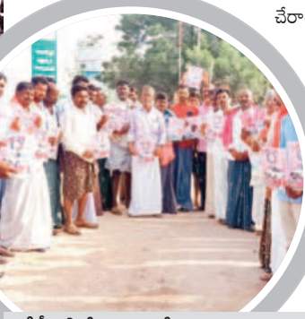
కేటీడోలో ప్రచారంలో పాల్గొన్న నాయకులు