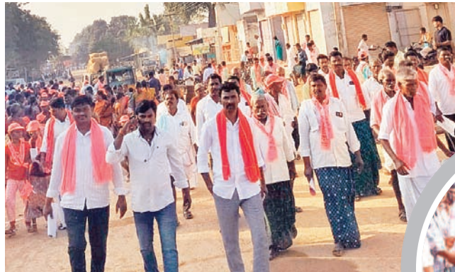
మల్లకల్లో భారీ ర్యాలీతో ప్రచారం నిర్వహిస్తున్న బీఆర్ఎస్ కార్యకర్తలు