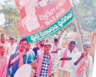
చిన్నమండడిలో డప్పు వాయిద్యాలతో ప్రచారం చేస్తున్న బీఆర్ఎస్ నాయకులు, కార్యకర్తలు