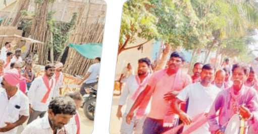
పెట్టేరులో నిర్వహించిన బీఆర్ఎస్ ర్యాలీ