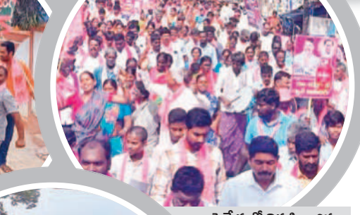
పెట్టేరులో నిర్వహించిన ర్యాలీలో జనం