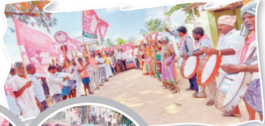
మల్కీమియన్ పల్లిలో ప్రచారం చేస్తున్న బీఆర్ఎస్ నాయకులు