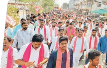
పెట్టేరులో నిర్వహించిన బీఆర్ఎస్ ర్యాలీ