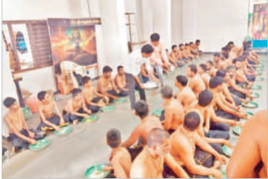
భక్తులకు అన్నప్రసాదం వడ్డిస్తున్న మజిలీ

◆ కేసీఆర్ ఆకాంక్ష తనకు స్ఫూర్తి అంటున్న మజిలీ