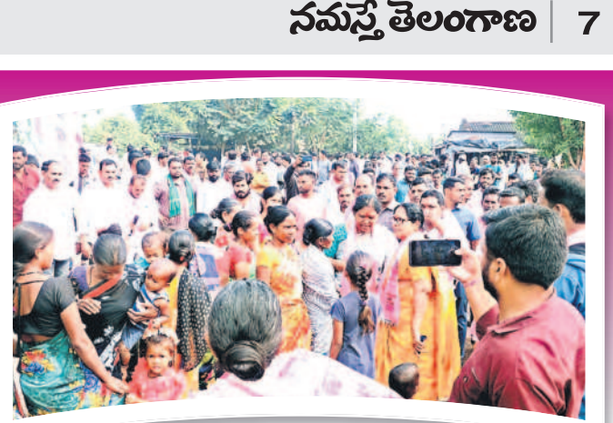
అసిఫాబాద్ నియోజకవర్గంలో మహిళలను ఓట్లు అభ్యర్థిస్తున్న జిల్లా అసెంబ్లీ అభ్యర్థి కోనప్ప