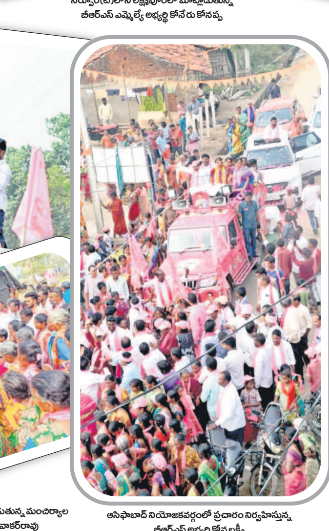
అసిఫాబాద్ నియోజకవర్గంలో ప్రచారం నిర్వహిస్తున్న జిల్లా అసెంబ్లీ అభ్యర్థి కోనప్ప