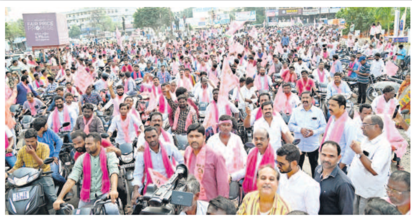
మంచిర్యాల బైక్ ర్యాలీలో పాల్గొన్న జిల్లా అసెంబ్లీ అభ్యర్థి