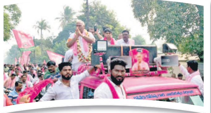
కాగజేనగర్ : రోడ్ షోలో ప్రజలకు అభివాదం చేస్తున్న జిల్లా అసెంబ్లీ అభ్యర్థి కోనప్ప