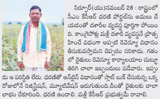
మా సమస్యలు తీరినయి..