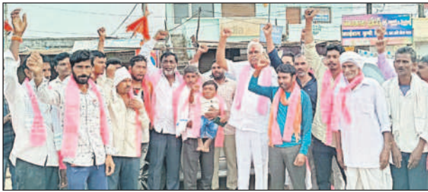
సిర్సూర్(టీ): బీఆర్ఎస్ లో చేరిన హద్దులీ, జక్కాపూర్ యువకులతో ఎమ్మెల్యే కోనేరు కోనప్ప