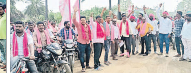
దహాగాం : కాగజ్ నగర్ కు బైక్ ర్యాలీగా తరలి వెళ్తున్న బీఆర్ఎస్ శ్రేణులు