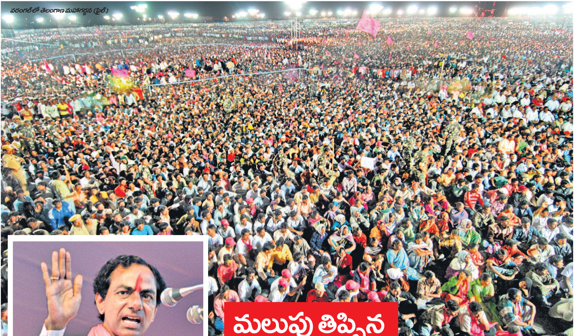
వరంగల్ లో తెలంగాణ మహాగర్జన (ఫైల్)