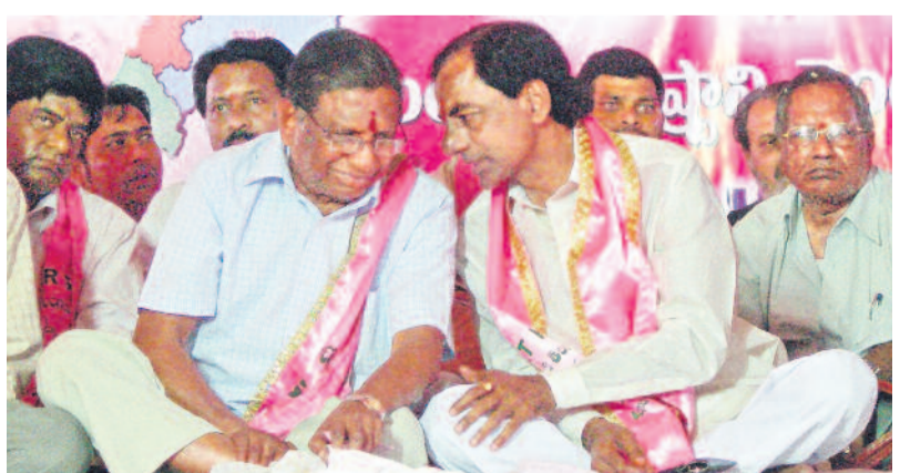
ప్రాధాన్యత జయశంకర్ తో కేసీఆర్ (ఫైల్)

తెలంగాణ రాష్ట్ర సాధన ద్యేయంగా కేసీఆర్ బయలుదేరినప్పటి నుంచి పుష్కరకాలం ఉద్యమానికి అటు అచార్యుల కొత్తపల్లి జయశంకర్ సారీ ఇటు ఉద్యమనేత కేసీఆర్ రెండు కాళ్లలా కలియదీచిగారు. జయశంకర్ సారీ పది మంది గుమిగూడినప్పుడు ఏ ఆర్థితో తెలంగాణ వాదాన్ని వినిపించారో.. 25 లక్షల మందితో 2010, డిసెంబర్ 16వ తేదీన వరంగల్ లో బీఆర్ఎస్ పార్టీ నిర్వహించిన తెలంగాణ మహాగర్జనలోనూ అంతే ఆర్థిని ఆవిష్కరించారు. తెలంగాణ సిద్ధాంతకర్తగా స్థిరపడిన జయశంకర్ సారీ జూన్ 21, 2011లో మరణించారు. తెలంగాణ ఒక్కసారిగా తల్లిదండ్రులు, రాష్ట్ర సాధన ఉద్యమంలో తన వేలుపట్టి నడిపించిన జయశంకర్ సారీ మరణం తనను తీవ్ర ద్విగ్ధునిగా గురిచేసిందని వెక్కిరిస్తూ ఏడ్చారు. ఆయన మరణం తెలంగాణకు తీరని లోటు. జయశంకర్ అంతిమసంస్కార యాత్ర తెలంగాణ లాంగ్ మార్చ్ తలపించింది.