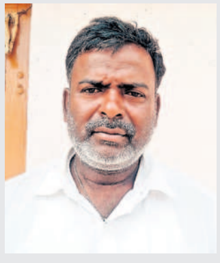
- కర్ణాటక నిర్లక్ష్యం, రైతు సంఘం మండల మాజీ సభ్యుడు

కాంగ్రెస్ పార్టీ చెప్పే ధరణి ఎత్తివేత, 24 గంటల కరెంటు రద్దు వల్ల రాష్ట్రం, రైతాంగం కేసీఆర్ పక్షపాది పక్షాదులు పూర్తిగా అయిపోయింది. ఇక పటిల్, పట్టాభిల పద్ధతి అన్న భూముల మీద గొప్పదనం దీమా పోతది. 3 గంటల కరెంటు సాగుకు ఏ మూలకు సలదు. ఎవుసం దెబ్బతింటుంది. గీ పదేండ్ల నందే.. తెలంగాణ రైతులు జర ఆనందంగా, మంచిగ బతుకుతుంటుంది. గిడంతా పెద్దసారు కేసీఆర్ పుణ్యమే బిడ్డా. గీ కాంగ్రెస్ పాలన మాకు పద్దు బిడ్డా. మల్లా గొప్పటి దినాలు గుర్తుకొస్తేనే శానా బాధైతది.