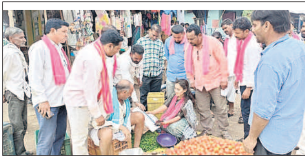
కెరమెరి: కారు గుర్తుకు ఓటియాలని వ్యాపారికి అవగాహన కల్పిస్తున్న ఎంపీపీ, జడ్పీటీసీ