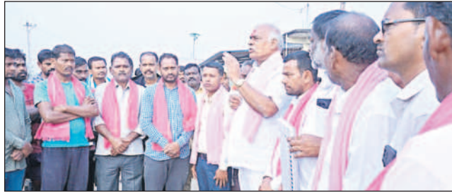
సిర్పూర్(టీ): బీఆర్ఎస్ లో చేరిన హద్దులీ, జక్కాపూర్ యువకులతో ఎమ్మెల్యే కోనేరు కోనేరుపల్లి, సిర్పూర్(టీ): లక్ష్మీపూర్ లో మాట్లాడుతున్న బీఆర్ఎస్ అభ్యర్థి ఎమ్మెల్యే కోనేరు కోనేరుపల్లి