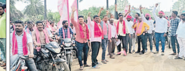
బెజ్జూర్ : మండల కేంద్రం నుంచి కాగజ్ నగర్ కు బైక్ ర్యాలీగా తరలి వెళ్తున్న నాయకులు దహగాం : కాగజ్ నగర్ కు బైక్ ర్యాలీగా తరలి వెళ్తున్న బీఆర్ఎస్ శ్రేణులు