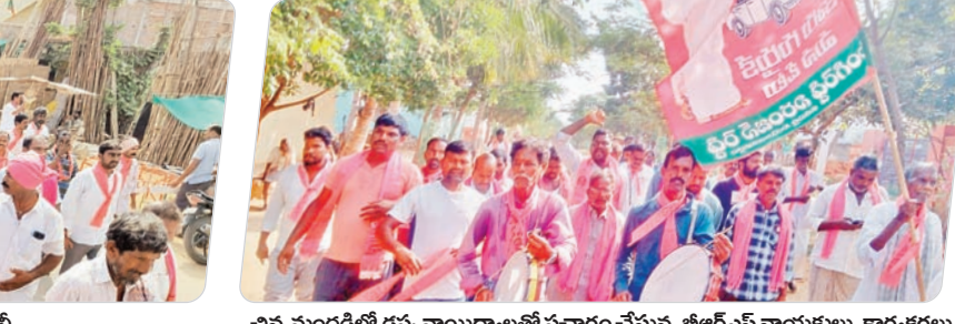
చిన్నమండలిలో డప్పు వాయిద్యాలతో ప్రచారం చేస్తున్న బీఆర్ఎస్ నాయకులు, కార్యకర్తలు