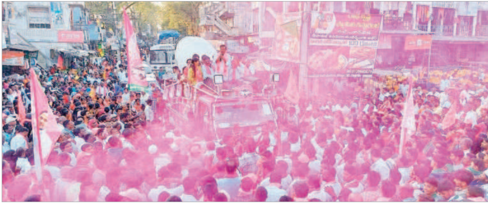
రోడ్ షోలో మాట్లాడుతున్న ఎమ్మెల్యే ఆల వెంకటేశ్వర్ రెడ్డి