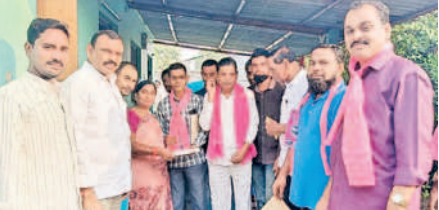
మంగళవేట : ప్రచారం చేస్తున్న బీఆర్ఎస్ నాయకులు