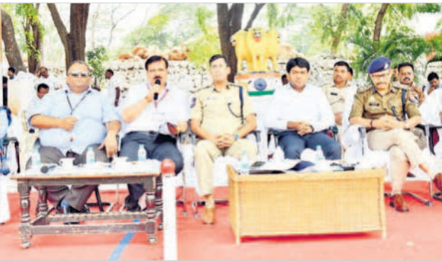
మహబూబ్ నగర్ లో ఎన్నికల విధులపై అవగాహన కల్పిస్తున్న అధికారులు

జిల్లాలో ఈనెల 30వ తేదీన నిర్వహించే నున్న పోలింగ్ కు ఎన్నికల రిటర్నింగ్ అధికారులు కలెక్షన్లతో కలిసి అన్ని ఏర్పాట్లు చేశారు. ఎలాంటి ఇబ్బంది లేకుండా గతంలో వచ్చిన ఫిర్యాదులను బట్టి ఓటర్లకు అవసరమైన పోలింగ్ కేంద్రాలను సిద్ధం చేశారు. ఈవీఎంలను ముందస్తుగా తనిఖీలు నిర్వహించి వాటిని భారీ భద్రత మధ్య నియోజమవర్గ కేంద్రాలకు తరలిస్తారు. బుధవారం వీటిని భారీ బందోబస్తు మధ్య ఆయా పోలింగ్ కేంద్రాలకు తరలిస్తారు. ఇప్పటికే ఓటింగ్ కు అవసరమైన ఓటర్ స్లిప్లను అందజేశారు. తుది ఓటరు జాబితాను ప్రకటించి ఆయా కేంద్రాలకు పంపించారు. ఓటు హక్కు వినియోగించుకునే దశకు పోలింగ్ కేంద్రాల వద్ద అవసరమైన టెంట్లు, తాగునీరు, వైద్యం తోపాటు అన్ని సౌకర్యాలను కల్పించారు. వృద్ధులు, దివ్యాంగులు ఓటు వేసేందుకు అవసరమైన వీల్ చైర్లను ఏర్పాటు చేశారు. ఇప్పటికే ఆయా పోలింగ్ కేంద్రాలను ఎన్నికల పరిశీలకులు తనిఖీలు చేశారు. సమస్యత్వ కేంద్రాలపై దృష్టి ఇంటింటికీ ఓటర్ స్లిప్ల పంపిణీ