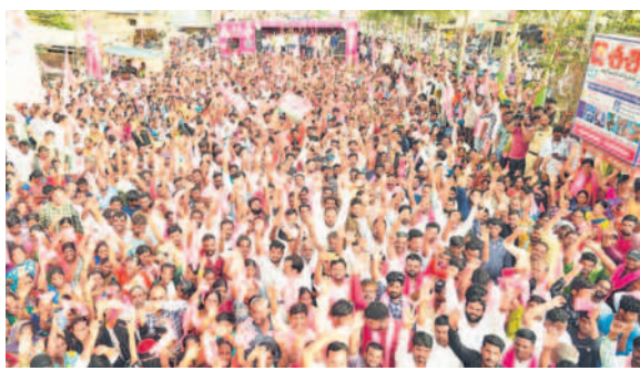
నాగర్ కర్నూల్ లో నిర్వహించిన రోడ్ షోకు హాజరైన ప్రజలు