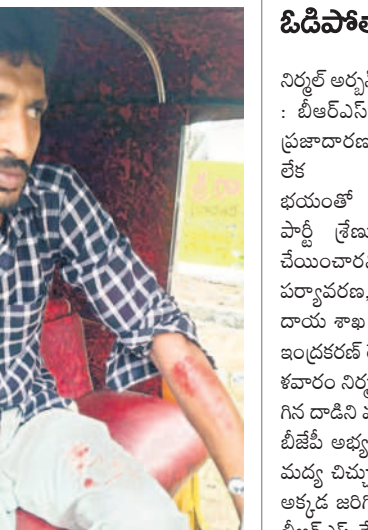
బీజేపీ కార్యకర్తల దాడిలో గాయపడ్డ బీఆర్ఎస్ కార్యకర్తను ఆరోగ్య విభాగానికి తరలింపు