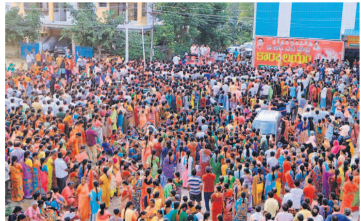
నకిరేకల్ రోడ్ షోకు హాజరైన ప్రజలు