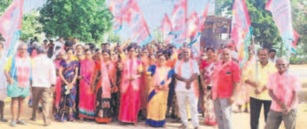
రామన్నపేట: వెల్లింకి గ్రామంలో ర్యాలీ నిర్వహిస్తున్న ప్రజలు, బీఆర్ఎస్ నాయకులు