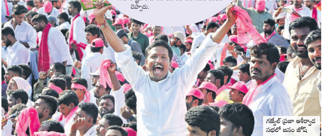
గజ్వేల్ ప్రజా ఆశీర్వాద సభలో జనం జోష్

దళితజాతి బిడ్డలు మన సాటి మనుషులే నని సీఎం కేసీఆర్ అన్నారు. వారు వివక్షకు, దోపిడికి గురయ్యారని, వారు కూడా మనతో పైకి రావాలని చెప్పారు. రాష్ట్రంలో దళితబంధు కార్యక్రమం అమలు చేస్తున్నట్లు తెలిపారు. గజ్వేల్ నియోజకవర్గ దళిత బిడ్డలందరికీ శుభవార్తను సీఎం కేసీఆర్ చెప్పారు. ఈ ఎన్నికలు పూర్తి కాగానే గజ్వేల్ నియోజకవర్గంలో ఒకే విధత అన్ని కుటుంబాలకు దళితబంధును అమలు చేస్తామని హామీ ఇచ్చారు. గజ్వేల్ నియోజకవర్గ దళిత వాడల నుంచి దరిద్రాన్ని పీకే అవతల పారేడ్డామని చెప్పారు. పంటల వైవిధ్యం పెంచాల్సిన అవసరం ఉందన్నారు. పుడ ప్రాసెసింగ్ యూనిట్ల రావాల్సిన అవసరం ఉందన్నారు. ప్రతి మండలంలో ఎక్కడికక్కడైనా ఆ పరిశ్రమలు రావాల్సిన అవసరం ఉందన్నారు. దాంట్లో రైతులందరూ వాటాదారులుగా కావాలన్నారు. రైతుల బిడ్డలందరికీ ఉద్యోగాలు దొరకాలన్నారు. గొప్ప పుడ ప్రాసెసింగ్ ఇండస్ట్రీగా తెలంగాణ రాష్ట్రం కావాలని తన కల అని సీఎం కేసీఆర్ చెప్పారు.