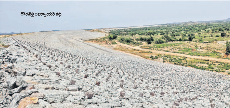
గౌరవెల్లి రిజర్వాయర్ కట్ట

హుస్సాబాద్, నవంబర్ 28 : శ్రీరాంసాగర్ రిజర్వాయర్ నుంచి వరద కాలువ ద్వారా హుస్సాబాద్ లాంటి మెట్ట ప్రాంతాలకు గోదావరి నీళ్లందించి కరువును పారదోలవచ్చని ఆరు దశాబ్దాల క్రితం ప్రతిపాదనలు చేసినప్పటికీ పాలకులు తాత్కాలికం చేశారు. ఒక ప్రభుత్వం వరద కాలువకు ప్రతిపాదనలు సిద్ధం చేస్తే ఆ తరువాత వచ్చిన ప్రభుత్వం అంచనాలు వేసి కాలువల తవ్వకం ప్రారంభించినప్పటికీ, చిన్నపాటి చెరువులను తలపించే రిజర్వాయర్ నిర్మాణానికి అనుమతులిచ్చింది. ఇందులో భాగంగానే 2007లో అప్పటి ముఖ్యమంత్రి రాజశేఖర్ రెడ్డి గౌరవెల్లి రిజర్వాయర్ కు 1.24టీఎంసీల సామర్థ్యంతో శంకుస్థాపన చేశారు. స్వయంగా సందర్శించిన సీఎం కేసీఆర్... తెలంగాణకు నీళ్లు, నిధులు, నియామకాల్లో జరుగుతున్న అన్యాయాన్ని గుర్తించిన కల్వకుంట్ల చంద్రశేఖర్ రావు తెలంగాణ ఉద్యమాన్ని ఉవ్వెత్తున ఉరికించి తెలంగాణ తెచ్చారు. తెలంగాణ తొలి ముఖ్యమంత్రిగా తెలంగాణలోని పల్లెలు బాగుపడాలంటే