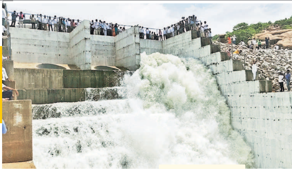
పంపుహౌజ్ నుంచి ఒకటోనెంబర్ పంపు ద్వారా రిజర్వాయర్లోకి దుంకుతున్న గోదావరి నీళ్లు (ఫైల్)