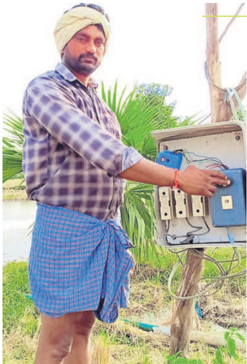
3గంటల కరెంట్ ఇచ్చే కాంగ్రెస్ వద్దు

వ్యవసాయంపై కాంగ్రెస్ కుట్రలపై భగ్గుమంటున్న రైతులు