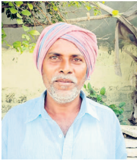
3గంటల కరెంటుతో రైతులకు ముప్పే