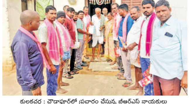
కులకచర్ల : చౌడాపూర్లో ప్రచారం చేస్తున్న బీఆర్ఎస్ నాయకులు