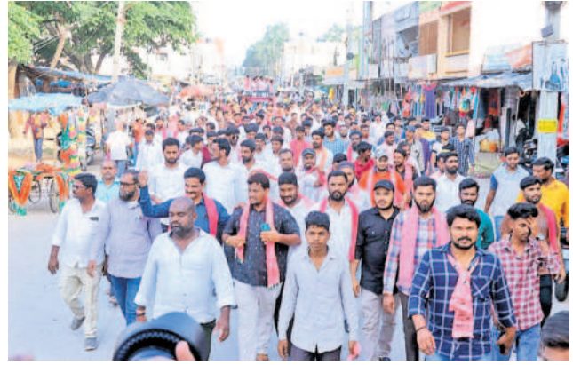
పరిగిలో నిర్వహించిన ర్యాలీలో పాల్గొన్న యువకులు