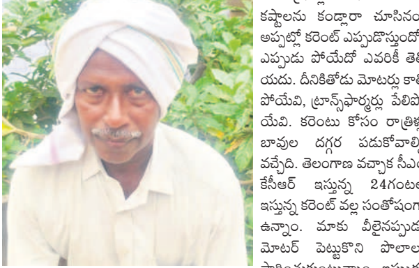
కాంగ్రెస్ పాలనలో కరెంటు కష్టాలు కండ్లారా చూసినన. అప్పుట్లో కరెంటు ఎప్పుడొస్తుందో, ఎప్పుడు పోయేదో ఎవరికీ తెలియదు. దీనికోసం మోటర్లు కాలిపోయేవి, ట్రాన్స్ ఫార్మర్లు పేలిపోయేవి. కరెంటు కోసం రాత్రిళ్లు బావుల దగ్గర పడుకోవాల్సి వచ్చేది. తెలంగాణ వచ్చాక సీఎం కేసీఆర్ ఇస్తున్న 24 గంటల కరెంటు ఇస్తున్న కరెంటు సంతోషంగా ఉన్నాం. మాకు వీలైనప్పుడు మోటర్ పెట్టుకొని పొలాలు పారించుకుంటున్నాం. ఇప్పుడు కాంగ్రెస్ పాలనలో కరెంటు పరిస్థితి అగమ్యగోచరంగా ఉంది. ఆడపాదపా వచ్చే కరెంటుకు నారు మడే ఎండిపోయేది. వచ్చిపోయే కరెంటుకు కారుకు పుట్టెడు గింజలు కూడా పండకపోయేవి. అప్పటి కరెంటు పరిస్థితులు యాదికొన్న కండ్లక నీళ్లు తిరుగుతే. కేసీఆర్ నారు పుణ్యమా అని ఇప్పుడు దినమంతా కరెంటు వస్తుంది. ఇలాంటి కరెంటు మోటర్లు పోస్తున్నాయే. పడేండ్ల సంది దండిగా వడ్డు పండుకున్నాయి. అప్పులన్నీ తీరి కొంత ఆర్థికంగా బలోపేతమయ్యాయి. ఇప్పుడు కాంగ్రె సోళ్లు తాము అధికారంలోకి వస్తే 3 గంటల కరెంటు ఇస్తామని చెబుతుండడంతో ఎనుకటి రోజుల యాదికొస్తున్నాయే. రైతులను ఆగం జేసేందుకు కుట్ర పన్నుతున్న కాంగ్రెసుకు వచ్చే ఎన్నికల్లో బుద్ధి చెబుతాం. 24 గంటల కరెంటు ఇస్తున్న కేసీఆర్ కు అండగా నిలుస్తాం.