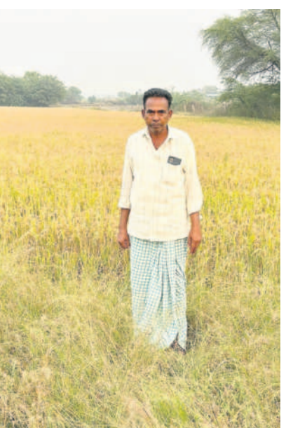
కాంగ్రెస్ తీరుపై రైతులను ఆగం