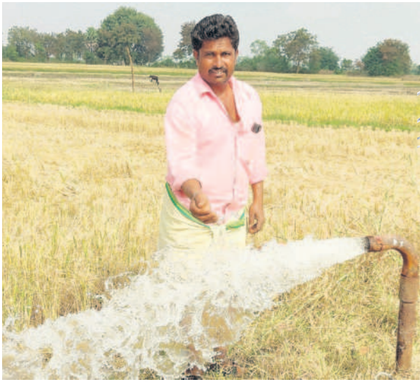
కుట్రల కాంగ్రెస్ కు బుద్ధి చెప్పాం

కాంగ్రెస్ హయాంలో కరెంటు పరిస్థితి అగమ్యగోచరంగా ఉంది. ఆడపాదపా వచ్చే కరెంటుకు నారు మడే ఎండిపోయేది. వచ్చిపోయే కరెంటుకు కారుకు పుట్టెడు గింజలు కూడా పండకపోయేవి. అప్పటి కరెంటు పరిస్థితులు యాదికొన్న కండ్లక నీళ్లు తిరుగుతే. కేసీఆర్ నారు పుణ్యమా అని ఇప్పుడు దినమంతా కరెంటు వస్తుంది. ఇలాంటి కరెంటు మోటర్లు పోస్తున్నాయే. పడేండ్ల సంది దండిగా వడ్డు పండుకు న్నాయి. అప్పులన్నీ తీరి కొంత ఆర్థికంగా బలోపేతమయ్యాయి. ఇప్పుడు కాంగ్రె సోళ్లు తాము అధికారంలోకి వస్తే 3 గంటల కరెంటు ఇస్తామని చెబుతుండడంతో ఎనుకటి రోజుల యాదికొస్తున్నాయే. రైతులను ఆగం జేసేందుకు కుట్ర పన్నుతున్న కాంగ్రెసుకు వచ్చే ఎన్నికల్లో బుద్ధి చెబుతాం. 24 గంటల కరెంటు ఇస్తున్న కేసీఆర్ కు అండగా నిలుస్తాం.