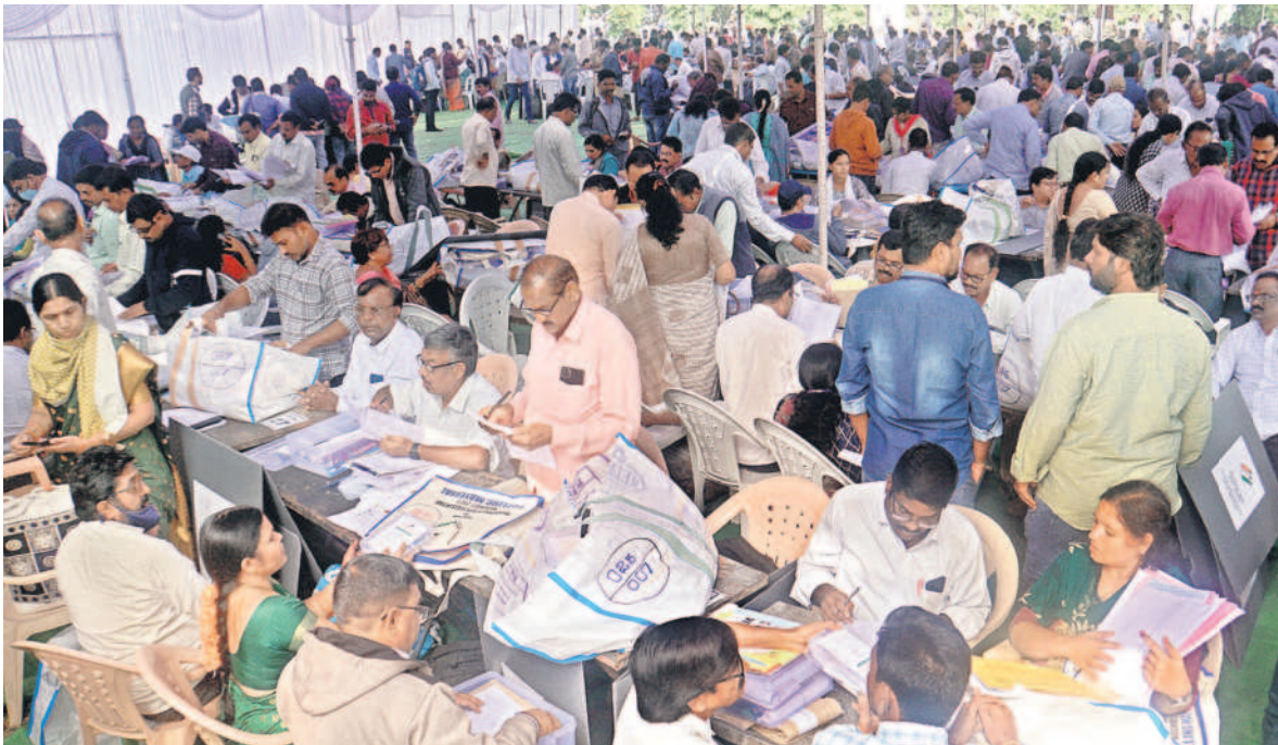
ఆదిలాబాద్ లో ఈవీఎంల పంపిణీ కేంద్రంలో ఎన్నికల విధులకు వెళ్లేందుకు సిద్ధంగా ఉన్న సిబ్బంది ఎన్నికల సామగ్రితో విధులకు వెళ్తున్న మహిళ

• ఉమ్మడి జిల్లాలో పోలింగ్ కు సర్వం సిద్ధం • కేంద్రాలకు చేరుకున్న సిబ్బంది, సామగ్రి