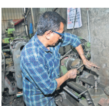
మిగిలారు. కరెంటు వచ్చిన తర్వాత మళ్లీ ఎనిమిది మంది అయ్యారు.

శివరామ్మక్క: చివరికి మమ్మల్ని సమ్మకున్న కార్మికుల్ని తీసేయాలి వచ్చింది. ఎదుగుతే ఇద్దరే