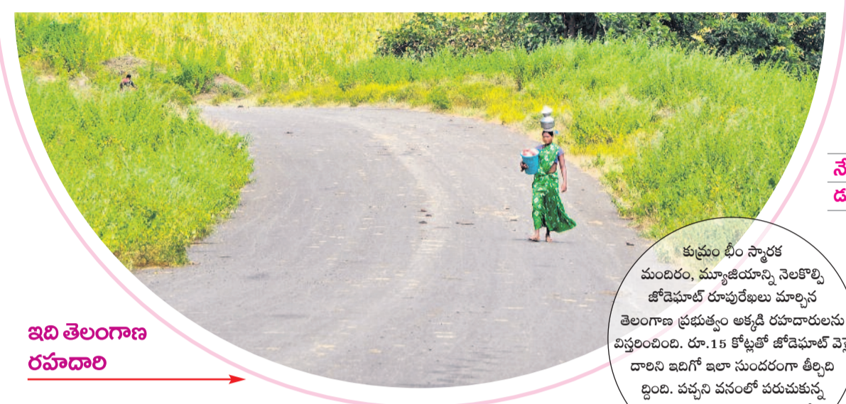
కుమ్రం భీం స్మారక మందిరం, మ్యూజియాన్ని నెలకొల్పి జోడెహూట్ రూపురేఖలు మార్చిన తెలంగాణ ప్రభుత్వం అక్కడి రహదారులను విస్తరించింది. రూ.15 కోట్లతో జోడెహూట్ వెళ్లే దారిని ఇదిగో ఇలా సుందరంగా తీర్చిదిద్దింది. పచ్చని వనంలో పరుచుకున్న తెలంగాణ దారి గిరిజనుల పురోగతికి రహదారింది!