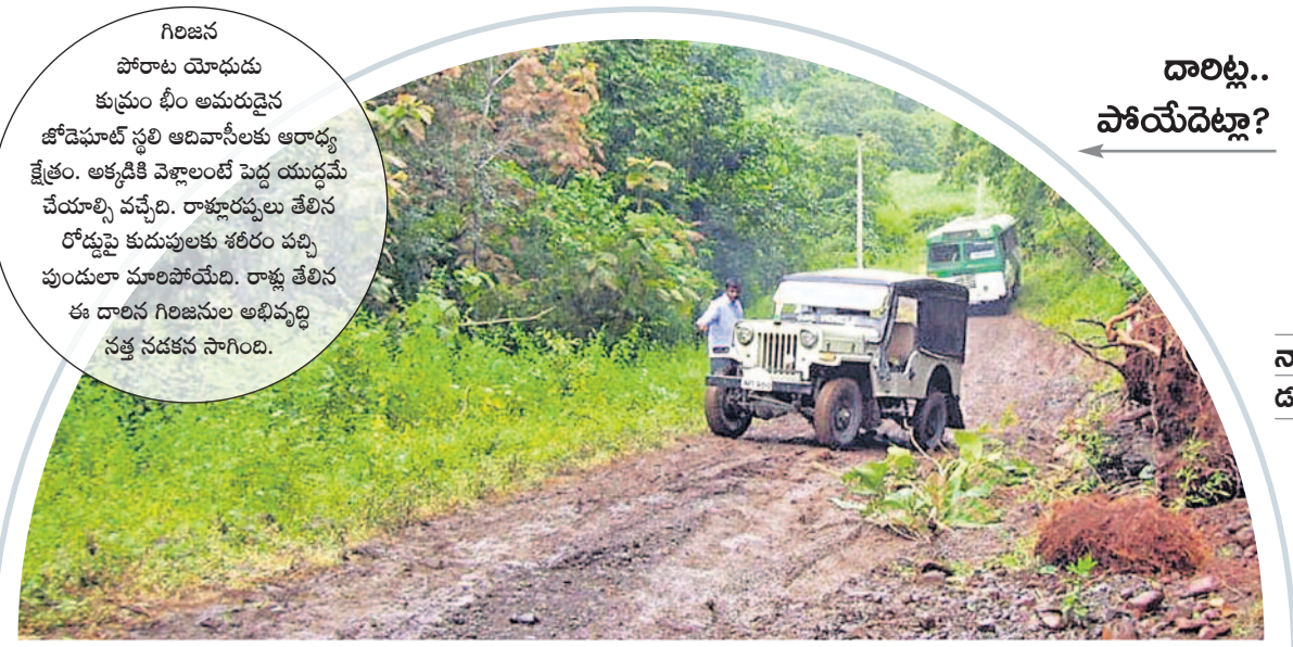
గిరిజన పోరాట యోధుడు కుమ్రం భీం అమరుడైన జోడెహూట్ స్థలి ఆదివాసీలకు ఆరాధ్య క్షేత్రం. అక్కడికి వెళ్ళాలంటే పెద్ద యుద్ధమే చేయాల్సి వచ్చేది. రాళ్ళూరపులు తెలివైన రోడ్డుపై కుడుపులకు శరీరం పచ్చి పుండులా మాలపోయేది. రాళ్ళు తెలివైన ఈ దారిని గిరిజనుల అభివృద్ధి సత్త నడకన సాగింది.

యాదగిరిగుట్ట క్షేత్రాన్ని ఇలవైకుంఠంగా తీర్చిదిద్దింది. ఇలా మన ముఖ్యమంత్రి ప్రతి సంతకం 58 ఏండ్లు అలిగోసలు అనుభవించిన తెలంగాణకు సంతసాన్ని చేకూర్చింది. అద్భుత ప్రతి పేదనూ ఆడుకున్నది. రైతును రాజును చేసింది. నేతన్నకు భీమానిచ్చింది. గీతకాలికి తాటిపెట్టెంత అందయ్యింది. ముసలవ్యక్తులకు ఆసరా అయ్యింది. ఒంటరి మహిళకు భరోసానిచ్చింది. అడవికొడుకు పుట్టింటి సారె అయ్యింది. కల్యాణ వదుపుకు షాదీ ముబారక్ చెప్పింది. ఒక్కమాటలో చెప్పాలంటే కేసీఆర్ దనకత్.. పదేండ్ల తెలంగాణను ఉత్సాహ శిఖరాలకు చేర్చి.. అసలు సిసలైన మార్చి అంటే ఏమిటో చాటిపెట్టింది. అందుకు సాక్ష్యమే ఈ చిత్రమాలిక..