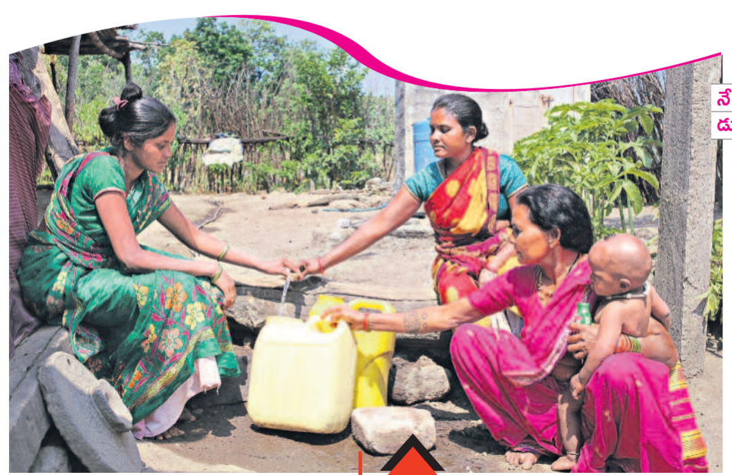
ఇంటి ముందుకు సంతోషం మిషన్ భగీరథ పుణ్యజలాలతో తెలంగాణలో తాగునీటి కష్టాలు పరారయ్యాయి. ఇంటి ముందుకే వచ్చిన నల్లను చూసి పల్లె పడుచుల సంతోషానికి అపభ్రష్టే. శుద్ధ జలాలతో నీజినల్ వ్యాధుల భయం పూర్తిగా తొలగిపోయింది. పడకే సిన మస్యం అన్న వార్తలు కనుమరుగయ్యాయి.