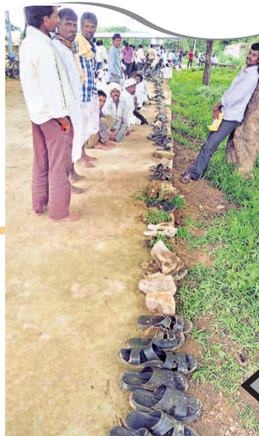
ఎరువుల యాతన కాంగ్రెస్ హయాం అంతా కరువులే! దీనికి తోడు రైతులకు మరో కష్టం ఎరువుల కరువు. మండలానికి ఎరువుల కోటా విడుదలైందని తెలియగానే వ్యవసాయ సేవా కేంద్రాల్లో వారిపోయేవారు రైతులు. తమ పంట వచ్చే వరకు నిలబడే ఓపిక లేక చెప్పలను క్యూలో పెట్టేవారు. ఈ చెప్పల బారు మెడకే జిల్లాలోనిది.