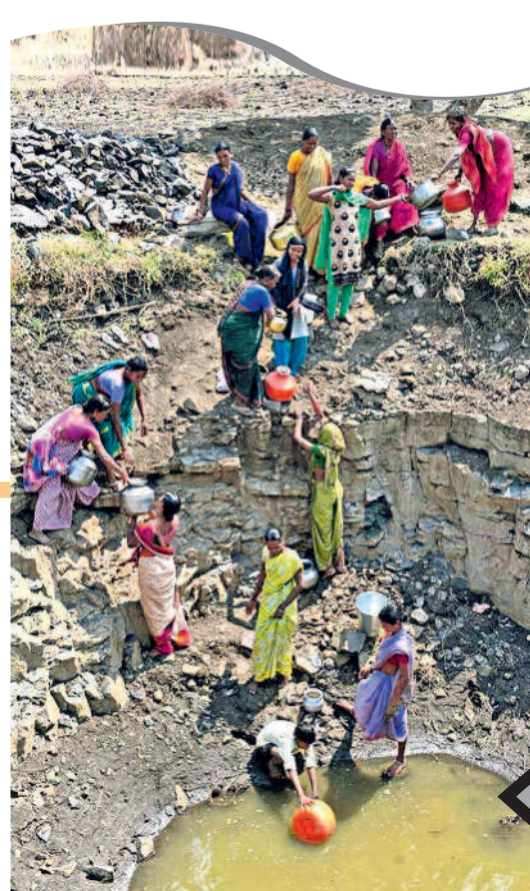
నూతి లోతు దుఃఖం నాటి పల్లె తెలంగాణ నీటి కష్టాలను ఈ చిత్రం కండ్లకు కడుతుంది. ఆదిలాబాద్ జిల్లా బోర్డ్ మండలం కేసంగూడ సహా ఆ పంచాయతీ పరిధి లోని వజ్రర్, నాగుగూడ, జైతుగూడ, మహాదు గూడ, లెడి గూడ పల్లెలు ఇదిగో ఇలా ఒకే బావిని నమ్మకొని ఎన్నో ఏండ్లు తిట్టులుపడ్డాయి.