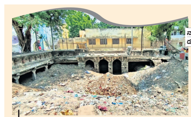
చరిత్రకు గ్రహణం ఇది చెత్త పారేసే డంపయార్డ్ కాదు. దీని కింద ఓ వారసత్వ సంపద సమాధి అయ్యింది. సమైక్య రాష్ట్రంలో తెలంగాణ ఎలా పాడుబడిందో హైదరాబాద్లోని బస్ స్టాల్ పేటలో ఉన్న మెట్లబావి దుస్థితిని చూస్తే తెలుస్తుంది. నగరం నడిబొడ్డున ఉన్నా.. అభివృద్ధికి నోచుకోకపోగా.. ఆగమైన తీరు కాంగ్రెస్ పాలనకు అద్దం పట్టింది.