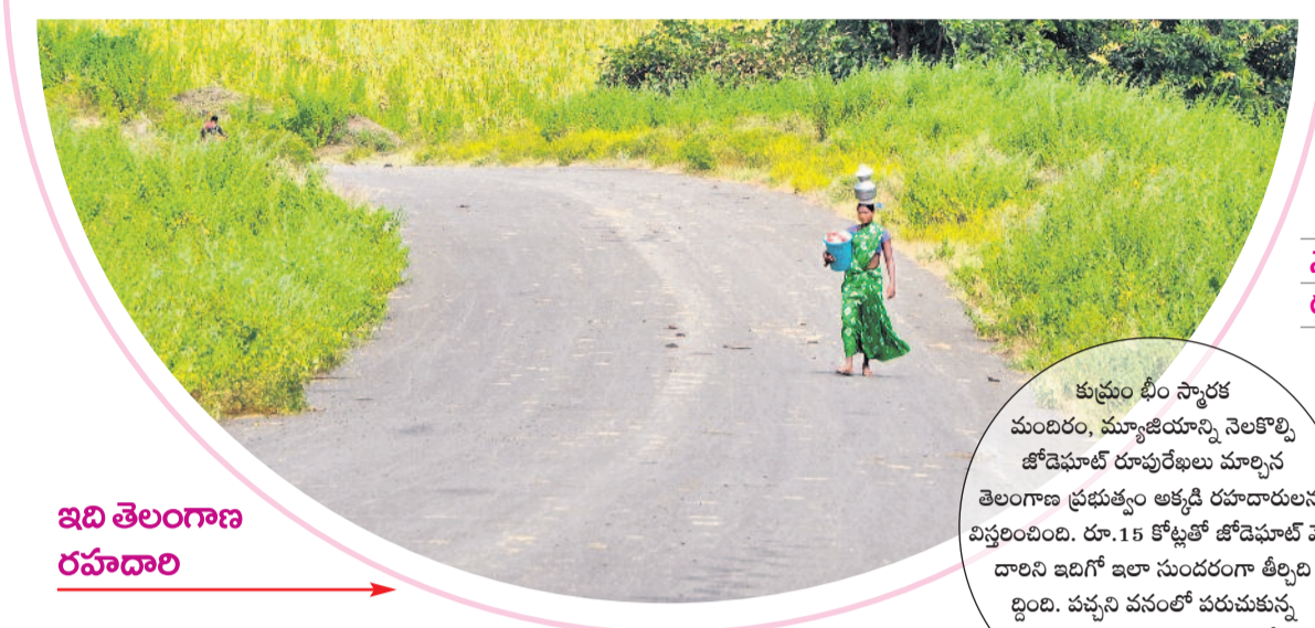
కుమ్రం భీం స్మారక మందిరం, మ్యూజియాన్ని నెలకొల్పి జోడెహూట్ రూపురేఖలు మార్చిన తెలంగాణ ప్రభుత్వం అక్కడి రహదారులను విస్తరించింది. రూ.15 కోట్లతో జోడెహూట్ వెళ్లే దారిని ఇదిగో ఇలా సుందరంగా తీర్చిదిద్దింది. పచ్చని వనంలో పరుచుకున్న తెలంగాణ దారి గిరిజనుల పురోగతికి రహదారింది!