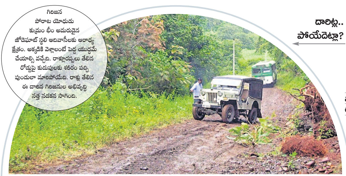
గిరిజన పోరాట యోధుడు కుమ్రం భీం అమరుడైన జోడెహూట్ స్థలి ఆదివాసీలకు ఆరాట్య క్షేత్రం. అక్కడికి వెళ్ళాలంటే పెద్ద యుద్ధమే చేయాల్సి వచ్చేది. రాళ్ళూరపులు తెలివైన రోడ్డుపై కుడుపులకు శరీరం పచ్చి పుండులా మాలపోయేది. రాళ్ళు తెలివైన ఈ దారిని గిరిజనుల అభివృద్ధి సత్త నడకన సాగింది.

యాదగిరిగుట్ట క్షేత్రాన్ని ఇలవైకుంఠంగా తీర్చిదిద్దింది. ఇలా మన ముఖ్యమంత్రి ప్రతి సంతకం 58 ఏండ్లు అలిగోసలు అనుభవించిన తెలంగాణకు సంతసాన్ని చేకూర్చింది. అద్భుత ప్రతి పేదనూ ఆడుకున్నది. రైతును రాజును చేసింది. నేతన్నకు భీమానిచ్చింది. గీతకాల్కుడికి తాటిపెట్టెంత అందయ్యింది. ముసలవ్యక్తులకు ఆసరా అయ్యింది. ఒంటరి మహిళకు భరోసానిచ్చింది. అడవికొడుకు పుట్టింటి సారె అయ్యింది. కల్యాణ వదుపుకు షాదీ ముబారక్ చెప్పింది. ఒక్కమాటలో చెప్పాలంటే కేసీఆర్ దనకత్.. పదేండ్ల తెలంగాణను ఉత్సాహ శిఖరాలకు చేర్చి.. అసలు సిసలైన మార్చి అంటే ఏమిటో చాటిచెప్పింది. అందుకు సాక్ష్యమే ఈ చిత్రమాలిక..