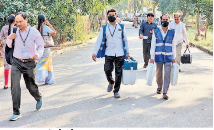
భవన్ కళాశాలలోని డీఆర్సీ నుంచి ఈవీఎంలను తీసుకువెళుతున్న ఎన్నికల సిబ్బంది

నేరేడ్మెట్, నవంబర్ 29: మల్కాజిగిరి నియోజక వర్గంలోని పోలింగ్ కేంద్రాలకు ఈవీఎంలను అధికారులు తరలించారు. బుధవారం ఉదయం నుంచి మధ్యాహ్నం వరకు నేరేడ్మెట్లోని భవన్ కళాశాలలో ఏర్పాటు చేసిన డీఆర్సీలో పీఓ, ఏపీఓలు, తదితర ఎన్నికల సిబ్బందికి పోలింగ్ ప్రక్రియపై ఎన్నికల అధికారులు అవగాహన కల్పించారు. అనంతరం సాయంత్రం కేటాయించిన పోలింగ్ కేంద్రాలకు ఆయా రూట్లలో గట్టి పోలీసు బందోబస్తు మధ్య ఎన్నికల సిబ్బంది ఈవీఎంలతో ప్రత్యేక బస్సుల్లో తరలి వెళ్లారు. అనంతరం ఆయా పోలింగ్ కేంద్రాల్లో సిబ్బంది మాక్ పోలింగ్ ప్రక్రియను పూర్తి చేశారు. గురువారం పోలింగ్ ప్రక్రియలో ఎలాంటి ఇబ్బందులు తలెత్తకుండా అన్ని ఏర్పాట్లు చేశామని మల్కాజిగిరి ఎన్నికల అధికారి రవికిరణ్ తెలిపారు. దివ్యాంగులు, అంధులు, సీనియర్ సిటిజన్లు ఓటు హక్కు వినియోగించుకునేందుకు అవసరమైన ఏర్పాట్లు చేశామని చెప్పారు.