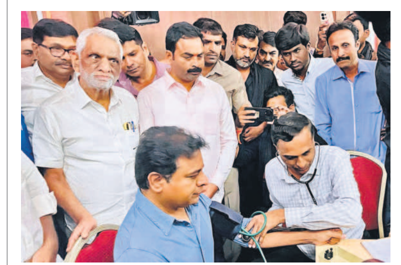
తెలంగాణ భవన్లో జరిగిన డిక్షా దివాన్ రక్తదాన శిబిరంలో మంత్రి కేటీఆర్ తో కలిసి హాజరైన ఎమ్మెల్యే శంభీపూర్ రాజు