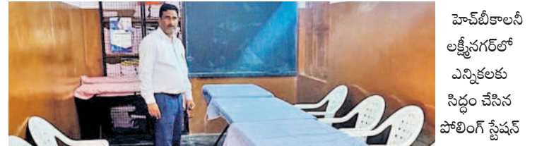
హెచ్బీకాలనీ లక్ష్మీనగర్లో ఎన్నికలకు సిద్ధం చేసిన పోలింగ్ స్టేషన్