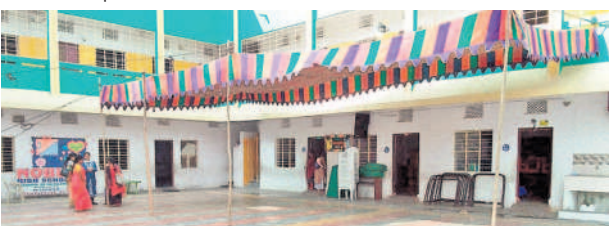
కాప్రా ఎల్లారెడ్డిగూడ సమీపంలోని ఓ ప్రైవేటు స్కూల్ భవనంలో ఏర్పాటు చేసిన పోలింగ్ కేంద్రం

ఉప్పల్ అసెంబ్లీ నియోజకవర్గంలో ఎన్నికల నిర్వహణ కోసం నియమించబడిన పోలింగ్ అధికారులు, సిబ్బంది వారికి కేటాయించబడిన పోలింగ్ కేంద్రాలకు బుధవారం సాయంత్రం చేరుకున్నారు. వారితో పాటు ఆయా కేంద్రాలకు కేటాయించబడిన పోలీసు సిబ్బంది, సహాయక సిబ్బందితో పోలింగ్ కేంద్రాల వద్ద సందడి నెలకొంది. పోలింగ్ బూత్లను ఎన్నికల సిబ్బంది గురు వారం జరిగే ఎన్నికలకు సిద్ధం చేసుకున్నారని సంబంధిత అధికారులు వెల్లడించారు.