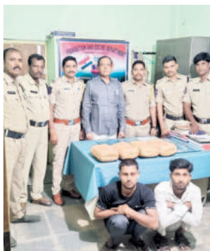
నిందితులను అరెస్ట్ చేస్తున్న అధికారులు