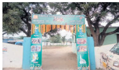
ధర్మసాగర్ మండలం సాయపేటలో..