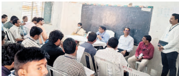
మైక్రో అబ్జర్వర్లకు సూచనలిస్తున్న జిల్లా ఎన్నికల జనరల్ అబ్జర్వర్ రవిశ్ గుప్తా