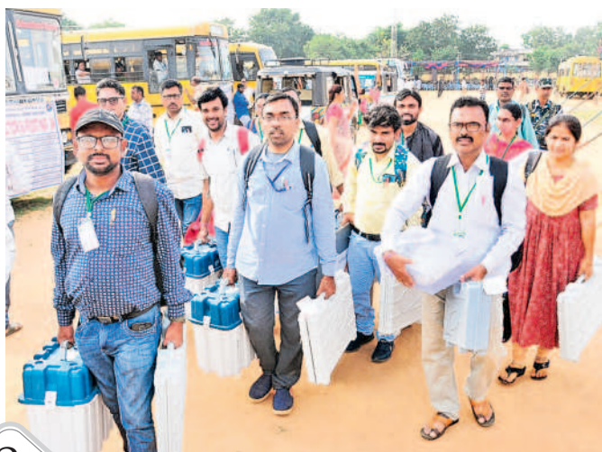
భూపాలపల్లిలో పోలింగ్ సామగ్రితో వెళ్తున్న సిబ్బంది

శాసన సభ ఎన్నికల పోలింగ్ కు సర్వం సిద్ధమైంది. గురువారం ఉదయం 7 గంటల నుంచి సాయంత్రం 5 గంటల వరకు పోలింగ్ ప్రక్రియ కొనసాగనుండగా, అధికారులు అన్ని ఏర్పాట్లు చేశారు. ములుగు, భూపాలపల్లి నియోజకవర్గాల్లో 620 పోలింగ్ కేంద్రాలను ఏర్పాటు చేశారు. భూపాలపల్లిలో 2,73,633 మంది ఓటర్లు ఉండగా 29 సెక్టార్లు, 29 రూట్లు, 101 బస్సులు ఏర్పాటు చేశారు. 1,732 మంది పోలింగ్ సిబ్బందిని నియమించారు. ములుగు నియోజకవర్గంలో 2,26,366 ఓటర్లు తమ ఓటు హక్కును వినియోగించుకునేందుకు 303 పోలింగ్ కేంద్రాలను సిద్ధం చేశారు. రెండు నియోజకవర్గాల్లో ఆదర్శ మహిళా, దివ్యాంగుల, యూత్ పోలింగ్ కేంద్రాలు పోలింగ్ కేంద్రాలను ఏర్పాటు చేశారు. సమస్యాత్మక కేంద్రాల వద్ద పోలీసులు ప్రత్యేక భద్రతా చర్యలు తీసుకున్నారు.