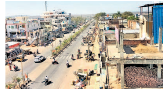
ములుగు జిల్లా కేంద్రం