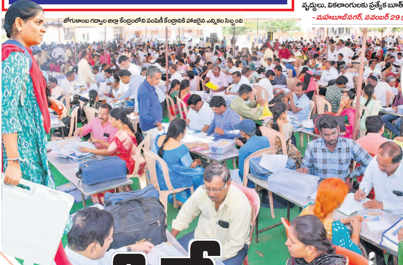
జోగుళాంబ గద్వాల జిల్లా కేంద్రంలోని పంపిణీ కేంద్రానికి హాజరైన ఎన్నికల సిబ్బంది