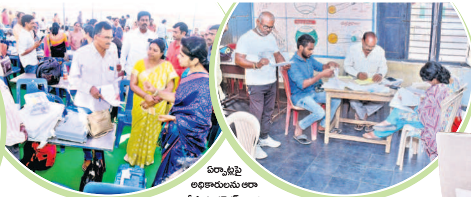
ఏర్పాట్లపై అధికారులను ఆరా తీస్తున్న కలెక్టర్ క్రాంతి