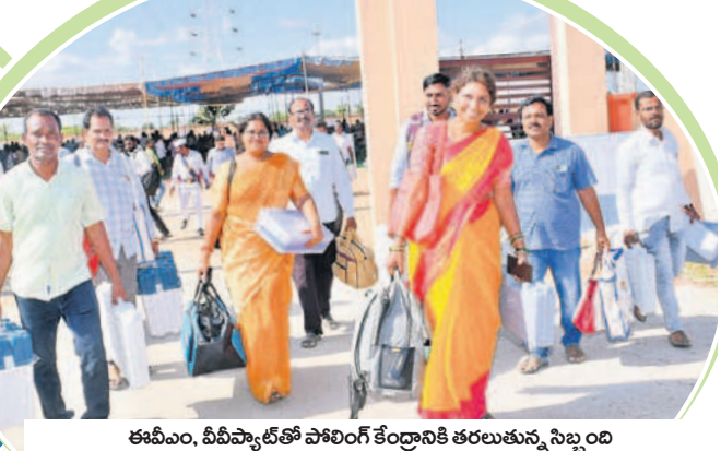
ఈవీఎం, వీవీప్యాట్లతో పోలింగ్ కేంద్రానికి తరలుతున్న సిబ్బంది