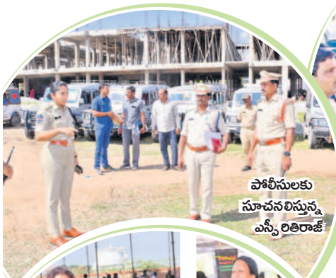
పోలీసులకు సూచనలనున్న ఎస్సీ లిటిరాజ్