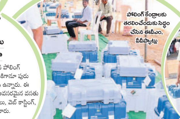
పోలింగ్ కేంద్రాలకు తరలించేందుకు సిద్ధం చేసిన ఈవీఎం, వీవీప్యాట్లు

352 మంది, ఎక్స్ నూర్ పురం 61వ పోలింగ్ కేంద్రంలో మొత్తం 863 మందికిగానూ పురుషులు 424, స్త్రీలు 439 మంది ఉన్నారు. ఈ కేంద్రాల్లో సిబ్బంది, ఓటర్లకు అవసరమైన వసతులను కల్పించారు. సీసీ కెమెరాలు, వెబ్ కాస్టింగ్, ప్రత్యేక బలగాలను నియమించారు.