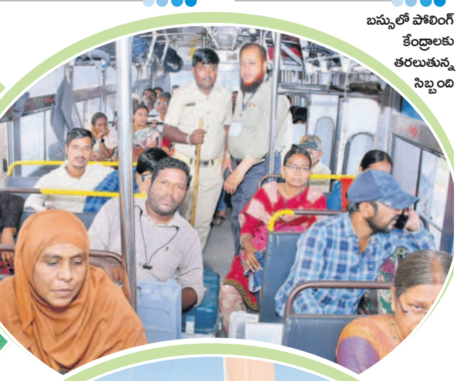
బస్సులో పోలింగ్ కేంద్రాలకు తరలుతున్న సిబ్బంది