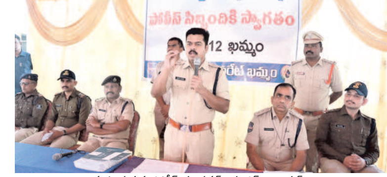
మాట్లాడుతున్న పోలీస్ కమిషనర్ విష్ణు ఎస్ వారియర్

అవాంఛనీయ ఘటనలు జరుగకుండా 390 క్రిటికల్ పోలింగ్ స్టేషన్లలో కేంద్ర సాయుధ పోలీసు బలగాలను మొహరించినట్లు తెలిపారు. ఈవీఎంల భద్రత, ఓట్ల లెక్కింపు రోజున కట్టుదిట్టమైన భద్రత కల్పించేలా పోలీస్ కార్యచరణ రూపొందించి