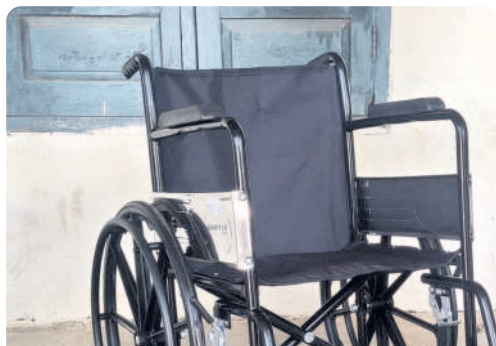
కారేపల్లి : లింగ్ కేంద్రంలో సీసీ కెమెరాలు, దివ్యాంగుల కొరకు ట్రైసైకిల్