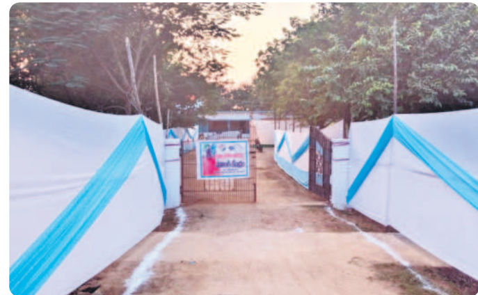
కొణిజర్ల : చిన్నగోపతిలో ఏర్పాటు చేసిన ఆదర్శ దివ్యాంగుల పోలింగ్ కేంద్రం

కొణిజర్ల, నవంబర్ 29 : మండలంలో పోలింగ్ ఏర్పాట్లకు అధికారులు సర్వం సిద్ధం చేశారు. కొణిజర్ల మండలంలో మొత్తం 27 పంచాయతీల్లో 60 పోలింగ్ స్టేషన్లు (135 నుంచి 194 బూత్ వరకు) ఏర్పాటు చేశారు. ఈ పోలింగ్ స్టేషన్లలో 48,826 మంది ఓటు హక్కు వినియోగించుకోనున్నారు. వీరిలో పురుషులు 23,798 మంది, మహిళలు 25027 మంది ఉన్నారు. ఇతరులు ఒకరు ఉన్నారు. ఓటింగ్ ప్రక్రియ నిర్వహించేందుకు మొత్తం 13, 14, 15, 16, 17 రూట్లూ విభజించారు. సుమారు 300 మంది పోలింగ్ సిబ్బంది విధులు నిర్వహించనున్నారు. కొణిజర్ల జిల్లా పరిషత్ పాఠ