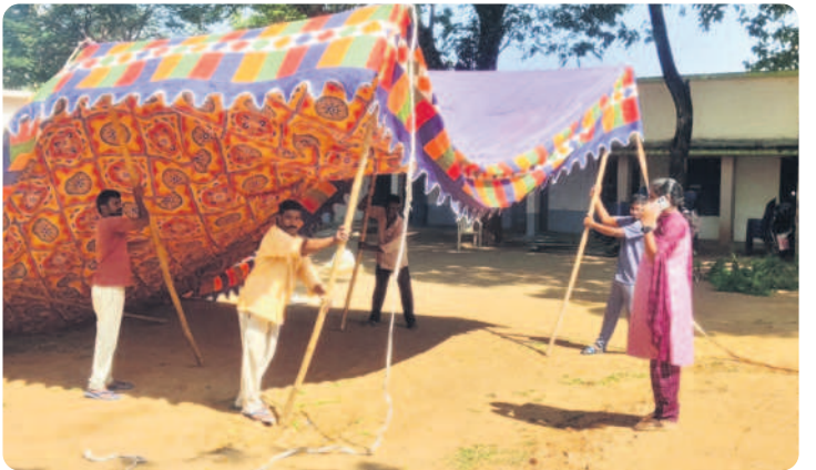
కారేపల్లి : పోలింగ్ కేంద్రం వద్ద ఏర్పాటు చేస్తున్న సిబ్బంది