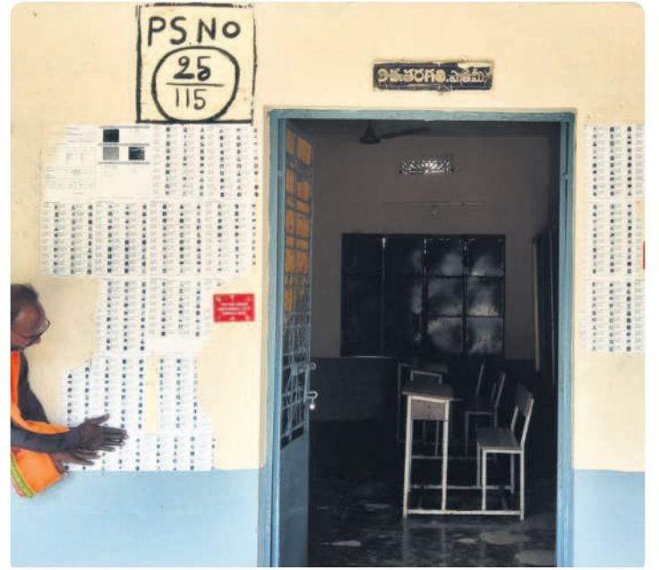
కారేపల్లి : పోలింగ్ బూత్ ఎదుట అందుబాటులో ఉంచిన ఓటర్ల జాబితా