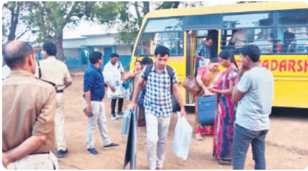
కొణిజర్ల : పోలింగ్ స్టేషన్లకు తరలివస్తున్న ఎన్నికల సిబ్బంది, వైరా టౌన్ : ఎన్నికల సామగ్రి పంపిణీ కేంద్రంలో మాట్లాడుతున్న కలెక్టర్, పక్కన సీపీ